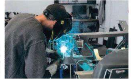
La cellule centrale ainsi que les berceaux avant et arrière sont fabriqués puis assemblés sur place.