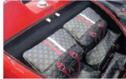
Le coffre à bagages de 280 dm 3 garni d'une ligne estampillée Devalliet.

voiture construite avec rigueur et passion, fiable et sécurisante. Le châssis est réalisé sur place dans un alu léger et particulièrement résistant. Il est conçu en trois parties : une cellule centrale et deux berceaux (avant et arrière) assemblés par soudures et tenons mortaises, ce qui facilitera les personnalisations futures. Les deux bosses derrière l'équipage ont varié de nombreuses fois avant de prendre leur aspect définitif, ce qui évitera ainsi les retours d'air comme sur certains cabriolets. Pareil pour le pédalier que nous avons repris près de vingt fois ; hauteur, profondeur, espace, rien n'est laissé au