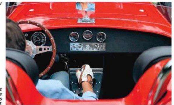
Le cockpit avec pommeau de levier de vitesses en alu massif.